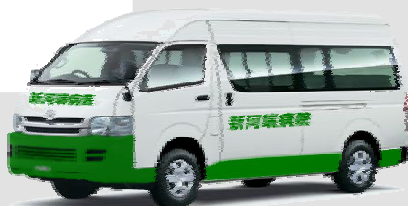
(写真はイメージです。実物と異なります)